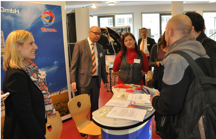
PRAXIS TRIFFT CAMPUS 2013