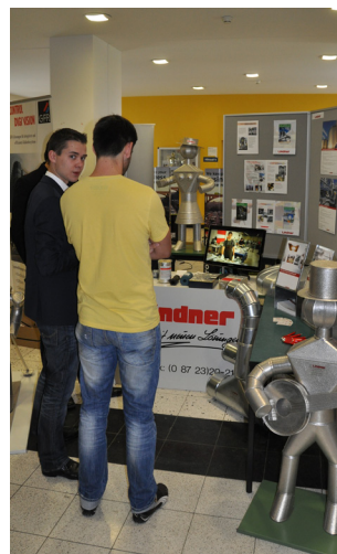
PRAXIS TRIFFT CAMPUS 2013